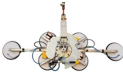
2145 X 1488 MM