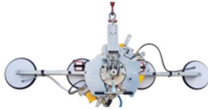
2530 X 310 MM