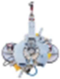
970 X 310 MM