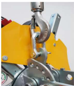
Système de suspension abaissé intégré