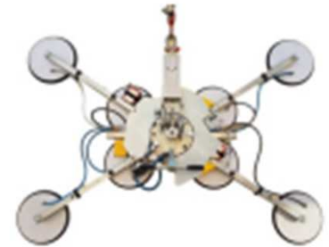
2 POSITIONS POSSIBLES 1700 X 1210 MM 2415 X 1488 MM