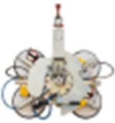
863 X 666 MM