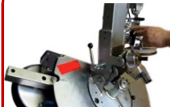
Basculement manuel assisté. Il vous assure de façon manuelle un basculement sécuritaire du palonnier en charge ou non, avec une précision au degré près.