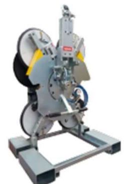
Rack de rangement et de transport